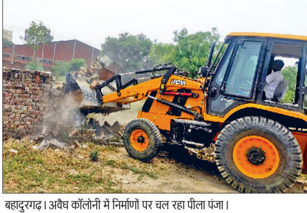
बहादुरगढ़। अवैध कॉलोनी में निर्माणों पर चल रहा पीला पंजा।