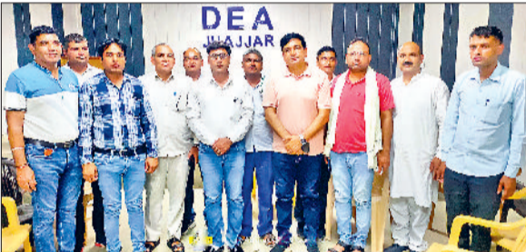
झज्जर। बैठक के दौरान उपस्थित कर्मचारी।

मंगलवार को पेंशन बहाली संघर्ष समिति के सभी ब्लॉक और जिले की कार्यकारिणी की बैठक डिप्लोमा इंजीनियर एसोसिएशन भवन में आयोजित की गई। बैठक का आयोजन राज्य कार्यकारिणी सदस्य डॉक्टर पुष्पेंद्र कादियान और जिलाध्यक्ष नवबहार यादव की अध्यक्षता में किया गया। इस दौरान अपने संबोधन में डॉक्टर पुष्पेंद्र कादियान ने कहा कि हरियाणा के सभी विभागों के कर्मचारी लंबे समय से पुरानी पेंशन बहाली के लिए आंदोलन कर रहे हैं लेकिन