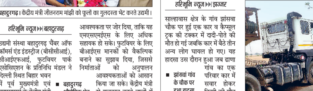
झंझर। दुर्घटना के बाद क्षतिग्रस्त हुई कार, दुर्घटना के बाद पीएचसी जमालपुर में एकत्रित लोग।

रिश्तेदार की मृत्यु पर शोक जताने के लिए ढाणा से कांधरा गांव जा रहे थे परिवार के सदस्य