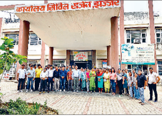
हरिभूमि न्यूज झज्जर

झज्जर। सीएमओ कार्यालय के बाहर खड़े होकर विरोध प्रदर्शन करते हुए एनएचएम कर्मचारी।