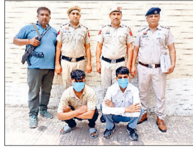
झज्जर। पकड़े गए आरोपी पुलिस टीम के साथ।